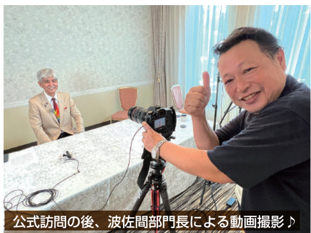
公式訪問の後、波佐間部門長による動画撮影♪