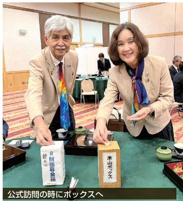
公式訪問の時にボックスへ