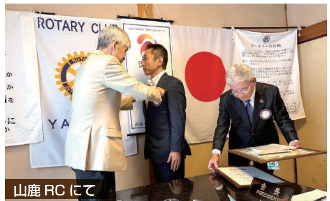
山鹿 RC にて