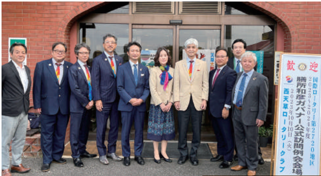
西天草 RC にて