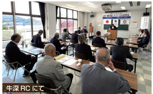
牛深 RC にて