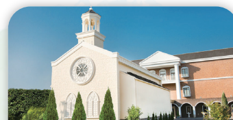
マリエール・オークパイン日田 〒877-0000 大分県日田市日の出町1-1 TEL.0973-22-1155