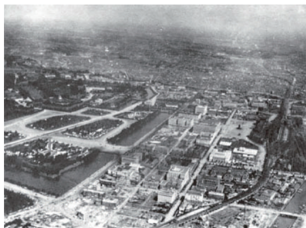
1923年(大正12年)関東大震災

長からすぐに東京ロータリークラブへ25,000ドルの見舞金を送られて来ました。さらにアメリカやイギリスのロータリークラブからも義援金や救援物資が送られました。義援金の総額は日本円で89,161円となり、これは当時の貨幣価値で3億円に相当する額でした。この義援金によって東京ロータリークラブは、東京の孤児院内に「ロータリーの家」を新築、消失小学校へ備品贈呈、医療機関への寄付、殉職警察官への援助などの活動を行ったのです。