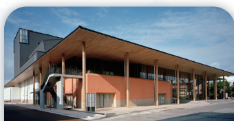
パトリア日田 〒877-0016 大分県日田市三本松一丁目8番11号 TEL.0973-25-5000