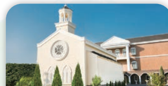
マリエール・オークパイン日田

〒877-0044 大分県日田市隈1丁目3-19 TEL.0973-23-3000